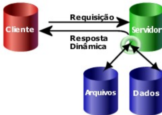
Figura 3. Requisição de página dinâmica