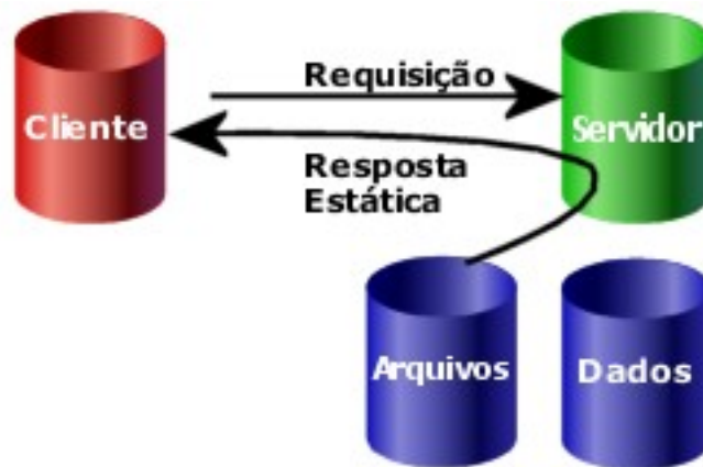
Figura 2. Requisição Normal